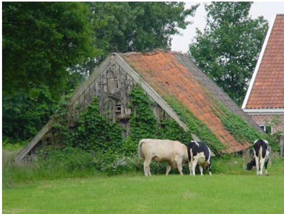
Een karakteristiek schuurtje

De Steenuil is de kleinste in ons land voorkomende uil. Met zijn lichaamslengte van 21 cm is hij maar net iets groter dan een merel. Het is een minder uitgesproken nachtvogel dan andere uilen. Daarom zie je ze ook nog wel eens overdag. Ze zitten dan vaak op het dak van een schuurtje, in de luwte en bij voorkeur in de zon. Steenuilen zijn bijzonder trouw aan een eenmaal gekozen territorium en ook paartjes blijven in principe levenslang bij elkaar. Het zijn echte holenbroeders. Nesten worden aangetroffen in holtes in knotwilgen, appelbomen en onder daken van schuurtjes. Ook broeden ze graag in nestkasten. In april worden gemiddeld 4 eieren gelegd. In de loop van juni verlaten de jonge uilen de broedplaats. Ze blijven daarna nog enige tijd in het ouderlijk territorium. In het najaar gaan ze dan op zoek naar een eigen gebied. Het voedsel bestaat uit insecten (kevers, larven, rupsen), muizen, regenwormen, kikkers en vogels.